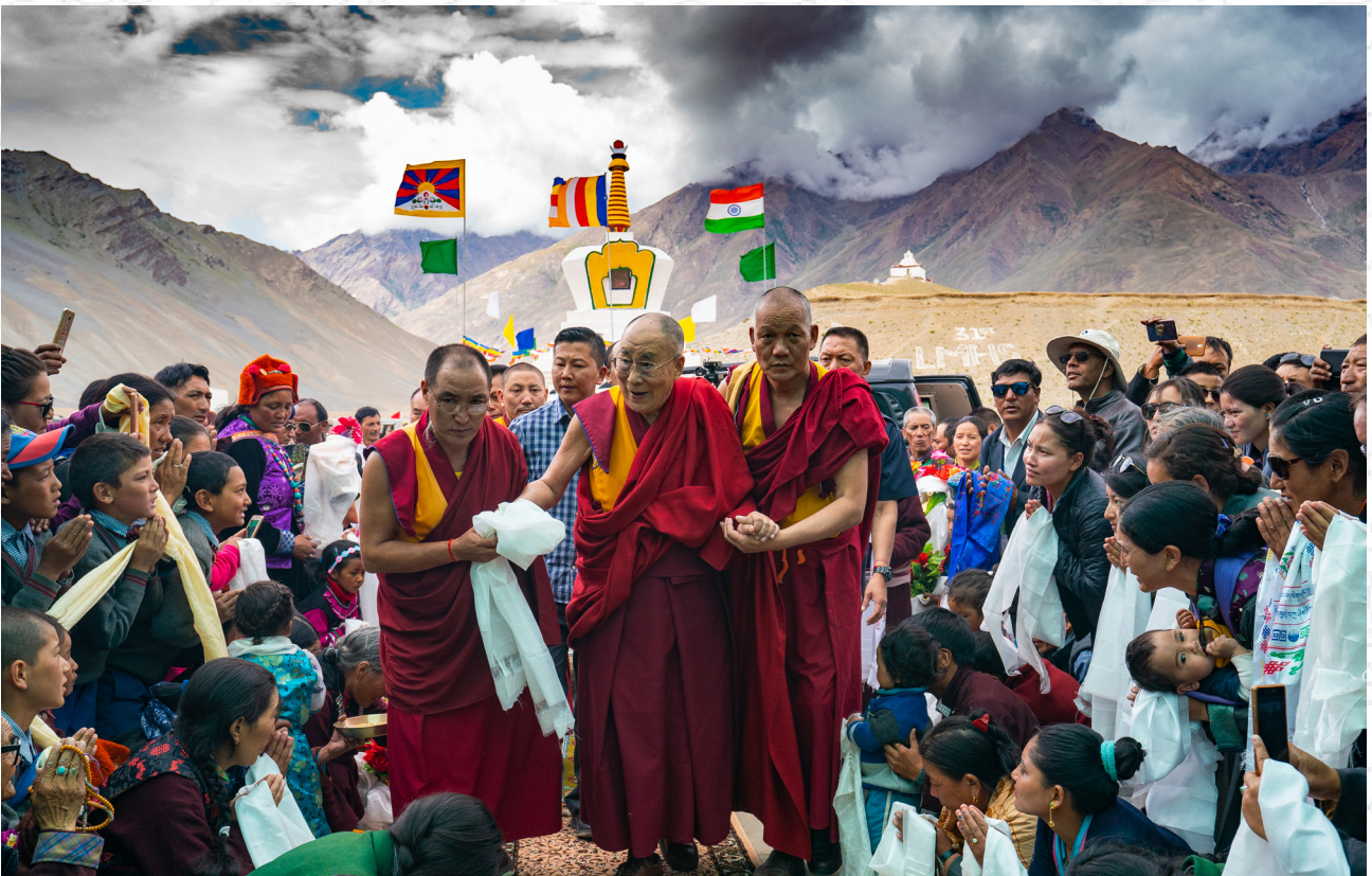
达赖喇嘛尊者参访印度拉达克藏斯卡地区的帕顿镇朗敦示范学校 2018年7月24日