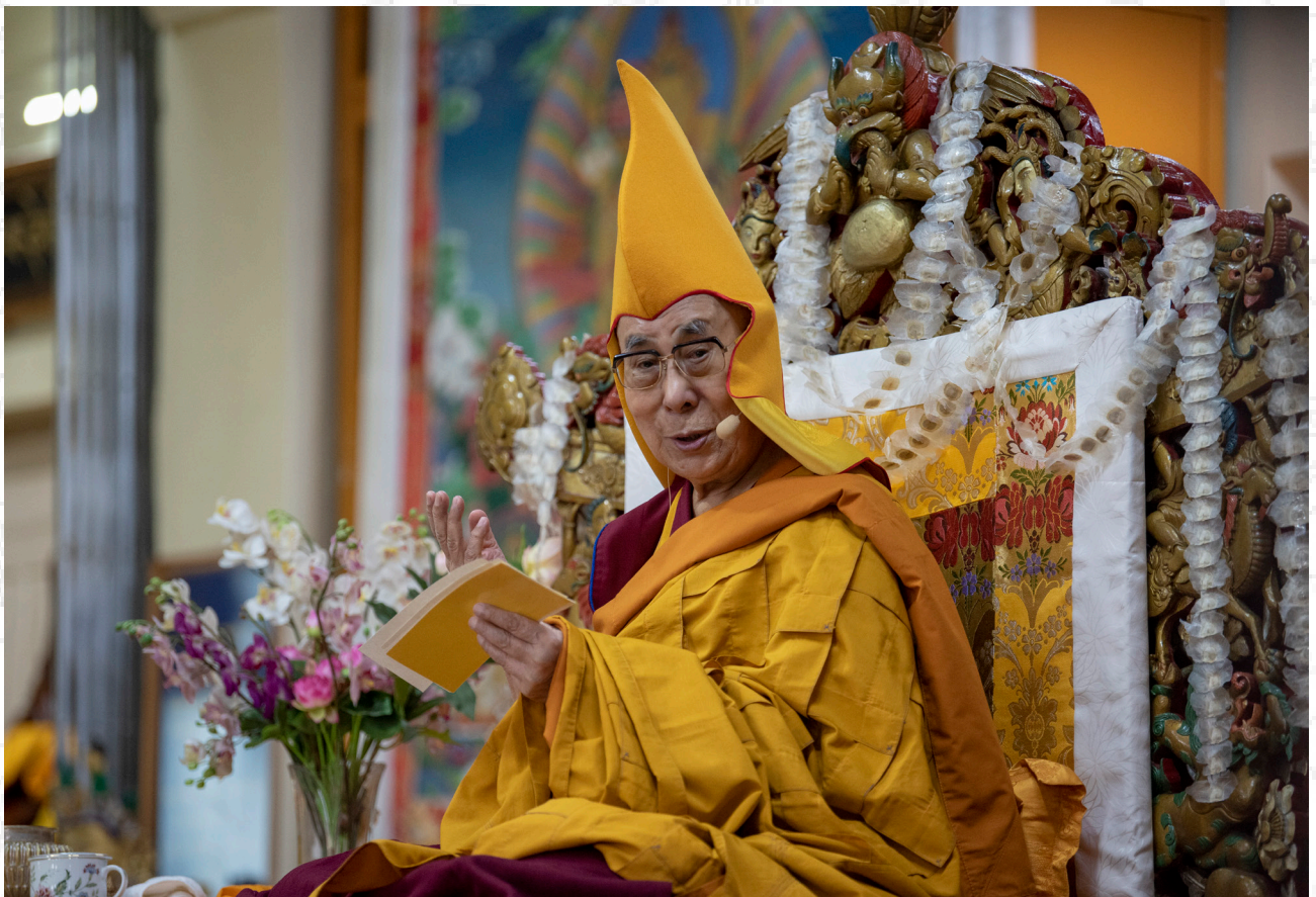
達賴喇嘛尊者在印北達蘭薩拉的大乘法苑參加由藏人行政中央退休公務員舉辦的長壽法會 2019年7月5日