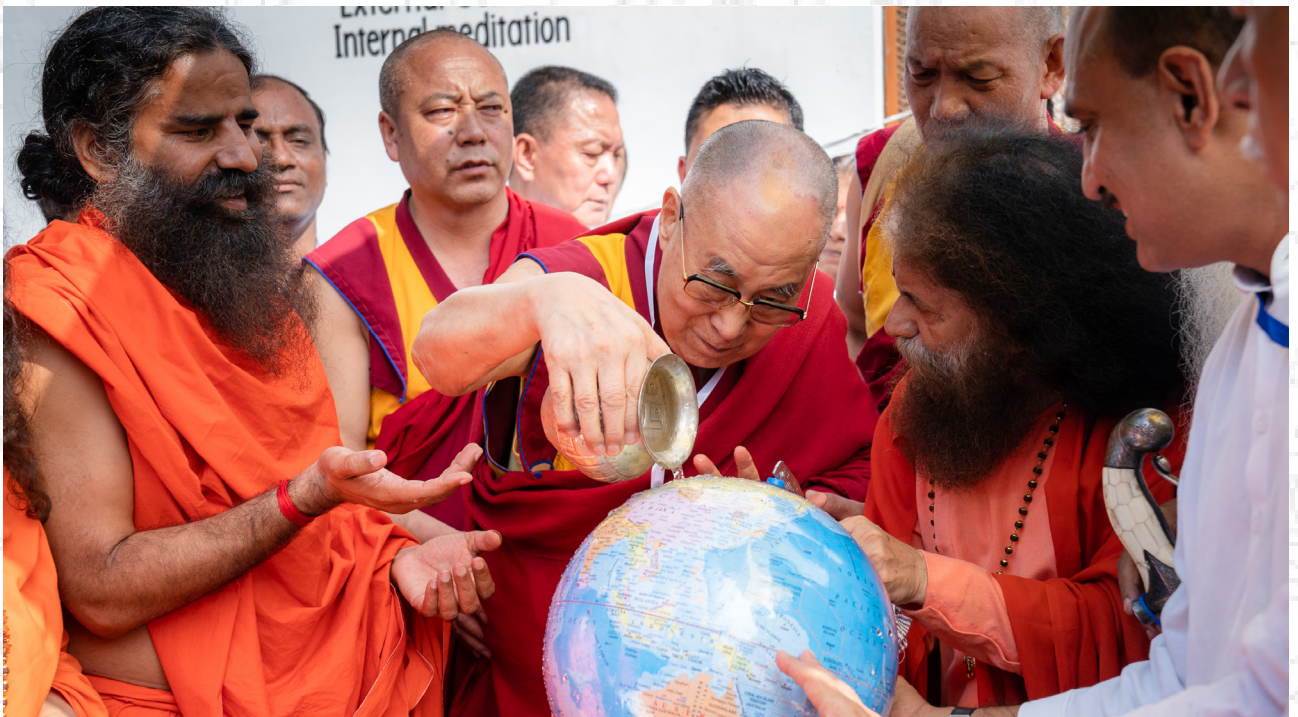
達賴喇嘛尊者在訪問印度新德里聖雄甘地圖書館時與印度教領袖們一道向地球儀澆水 2019年9月25日