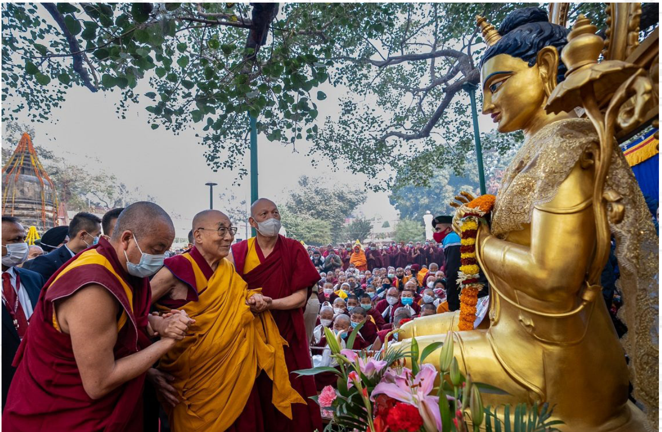
達賴喇嘛尊者在印度佛教聖地菩提伽耶的摩訶菩提寺中參拜佛陀聖像 2023年1月19日