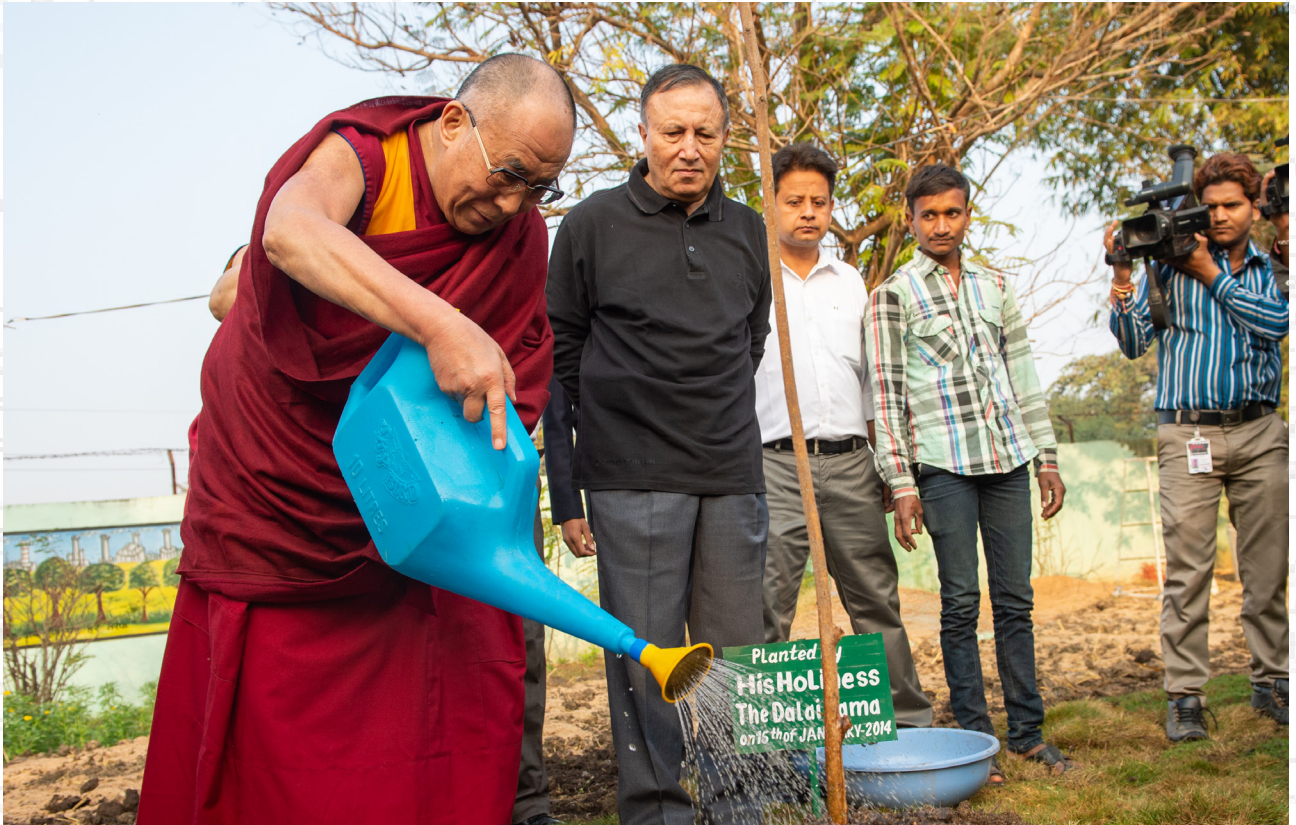
达赖喇嘛尊者在印度恰蒂斯加尔邦赖布尔的总督府内种植一颗菩提树 2014年1月15日