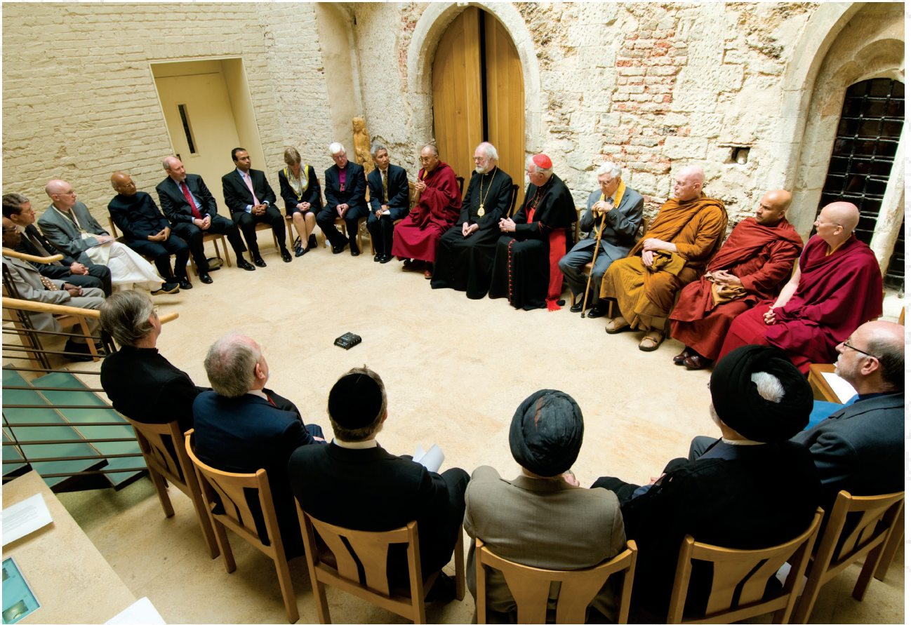
達賴喇嘛尊者在倫敦蘭貝斯宮會見全球各大宗教團體的領袖及代表 2008年5月23日 照片 | 西藏博物館