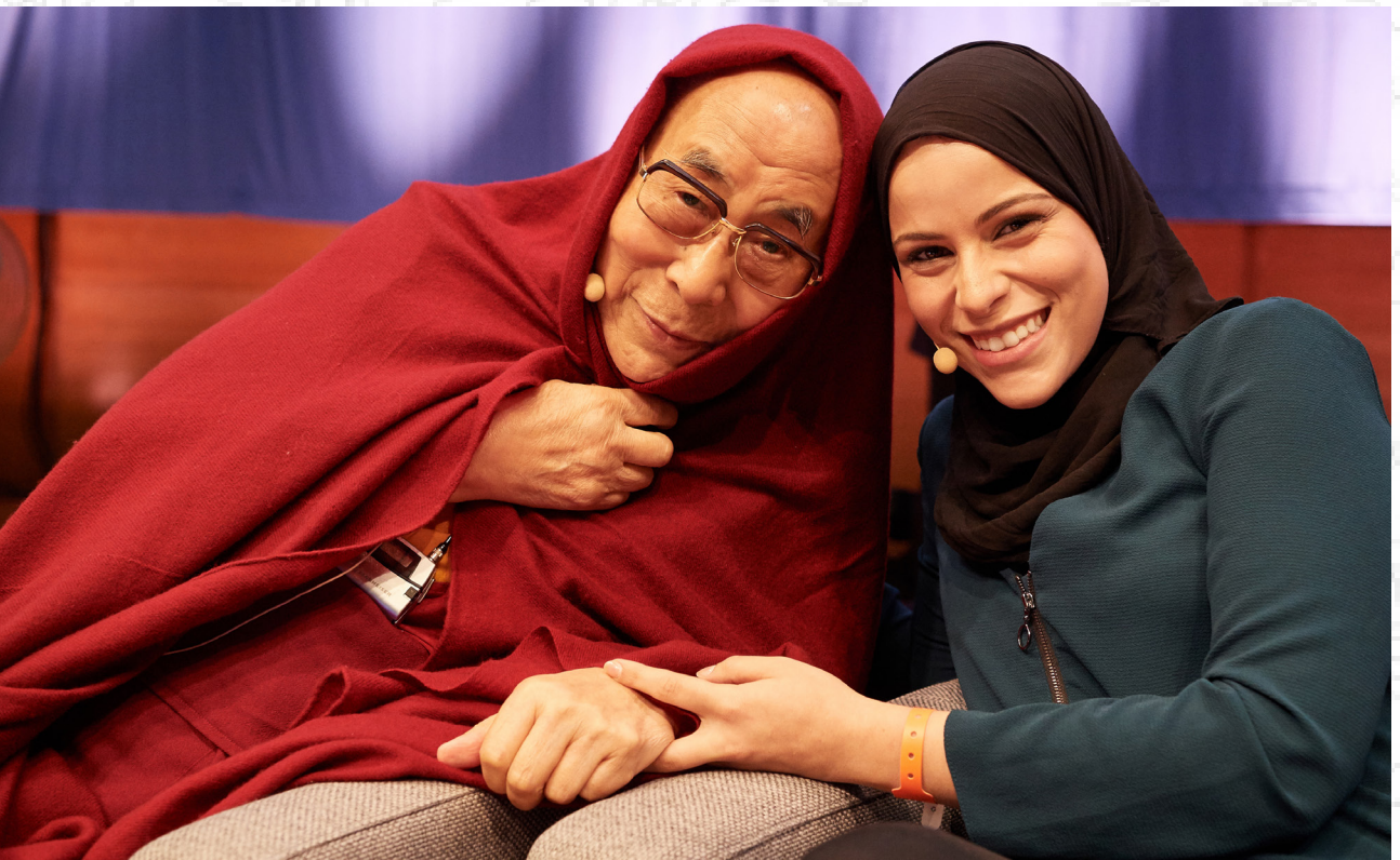
達賴喇嘛尊者在比利時博扎爾美術中心舉行的「思想與生活對話」第二天上午的會議開始前與阿拉·穆拉比特女士合影留念 2016年9月10日