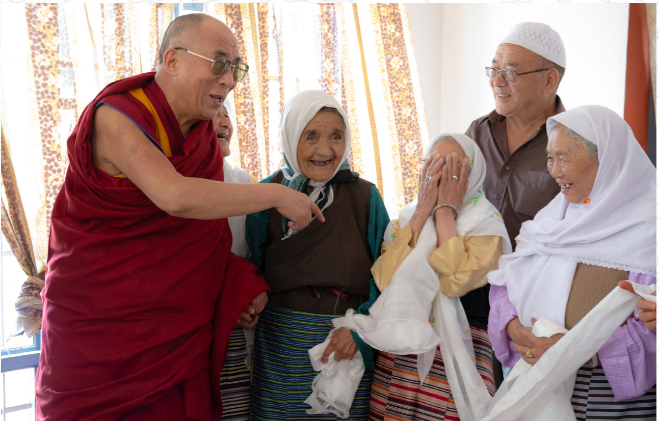
達賴喇嘛尊者在印度查謨-克什米爾邦首府查謨-克什米爾邦接見藏人穆斯林信眾 2012年7月14日