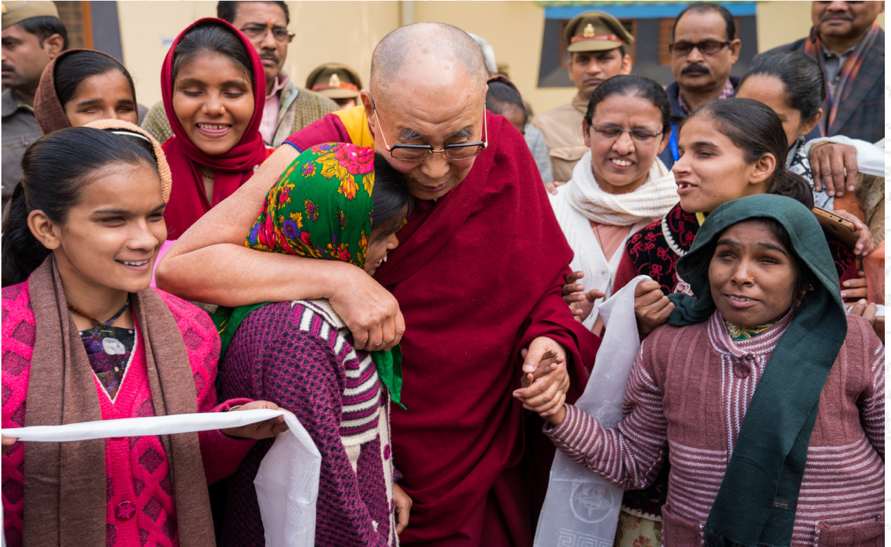
達賴喇嘛尊者在印度瓦拉納西的鹿野苑接見一批來自附近盲人學校的學生及弱視婦女 2017年12月31日