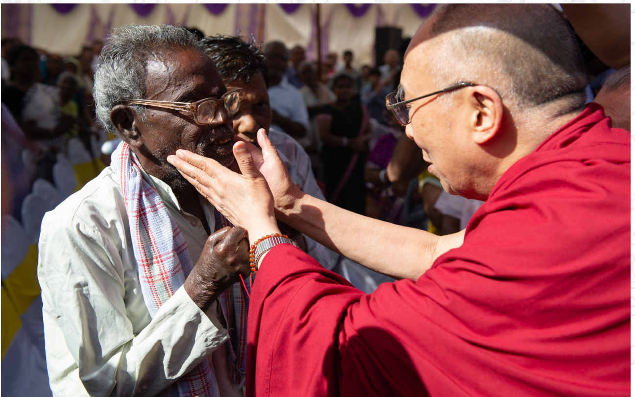
達賴喇嘛尊者在參訪印度首都新德里的塔伊爾布麻風病綜合治療中心時與迎接他的一位民眾進行互動 2014年3月20日