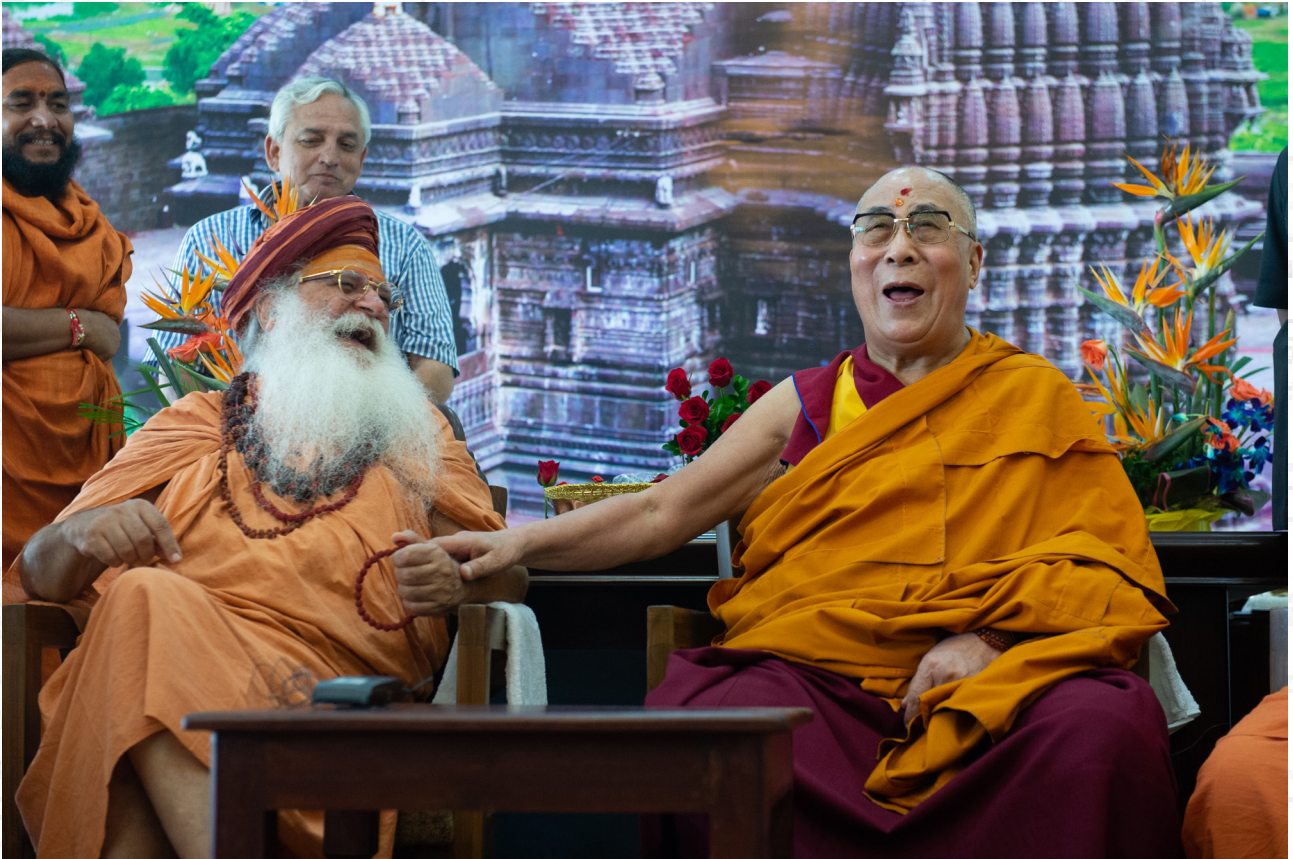
達賴喇嘛尊者與在印度馬哈拉施特拉邦納西克與媒體成員會面 2015年8月30日