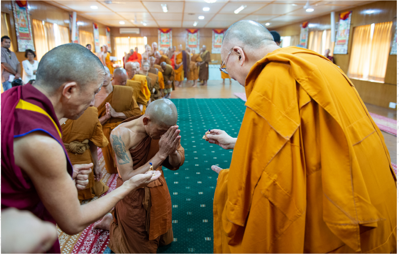
達賴喇嘛尊者在印度北部達蘭薩拉的寢宮向來訪的泰國僧眾贈送佛像 2016年5月20日