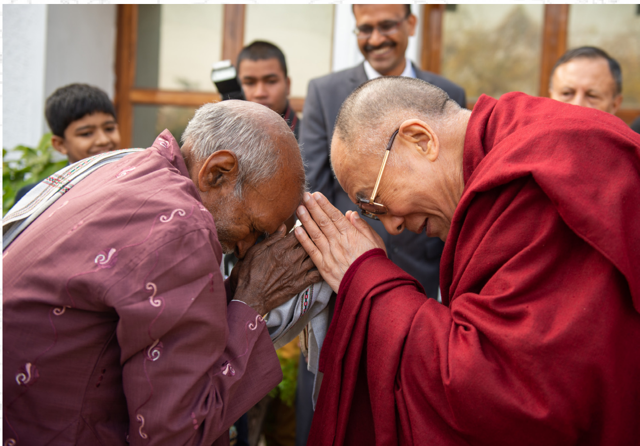
达赖喇嘛尊者在印度恰蒂斯加尔邦赖布尔的总督府向一名工作人员致意 2014年1月15日

確實人口的增加也是一個很大的問題，我們要更務實的去解決這些問題。這個星球的食物、資源是有限的，還有全球暖化的問題，也是非常嚴峻，在數十年後許多的河流將有可能會乾枯，所以我們更要完整的、全面的角度去看待這些事情，包括人口劇增的問題。越來越多的人會造成資源的短缺，所以控制生育說不定也是一個方式。總之，我們要透過全面的分析來做判斷，才能做務實的決策，說不定還有一個很好的方式，那就是更多人去出家吧！那就可以控制生育了，哈哈！！！！