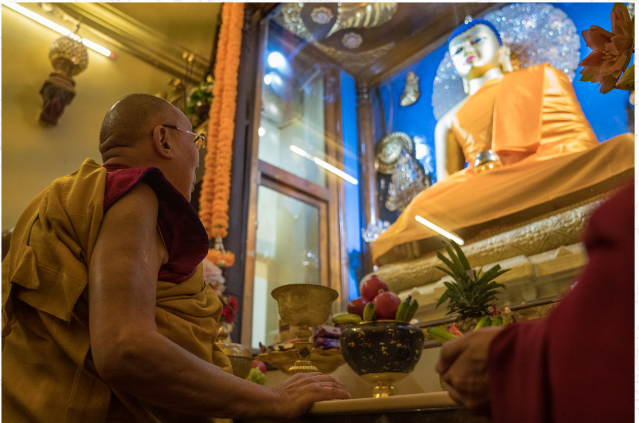
達賴喇嘛尊者在印度佛教聖地菩提伽耶正覺塔中的佛陀釋迦牟尼像前祈禱 2019年1月2日